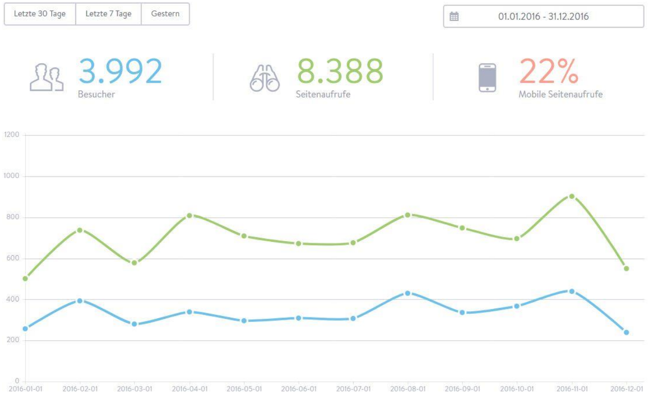
Abbildung 1 oberwinter.de (2016)